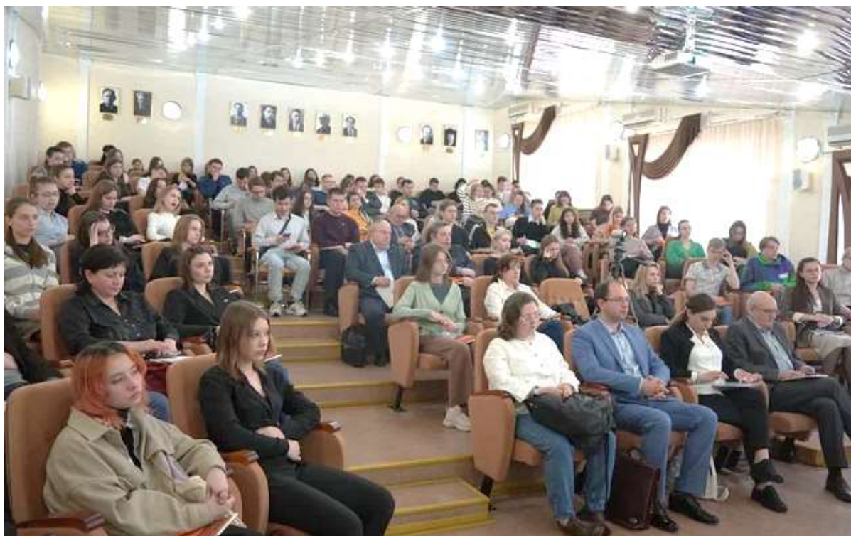
Рисунок 2 – Пленарное заседание форума