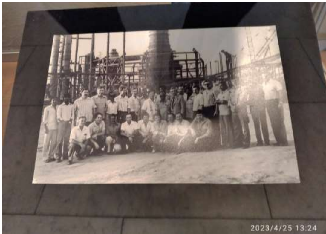
Рисунок 21 – Фото липецких и индийских металлургов и строителей