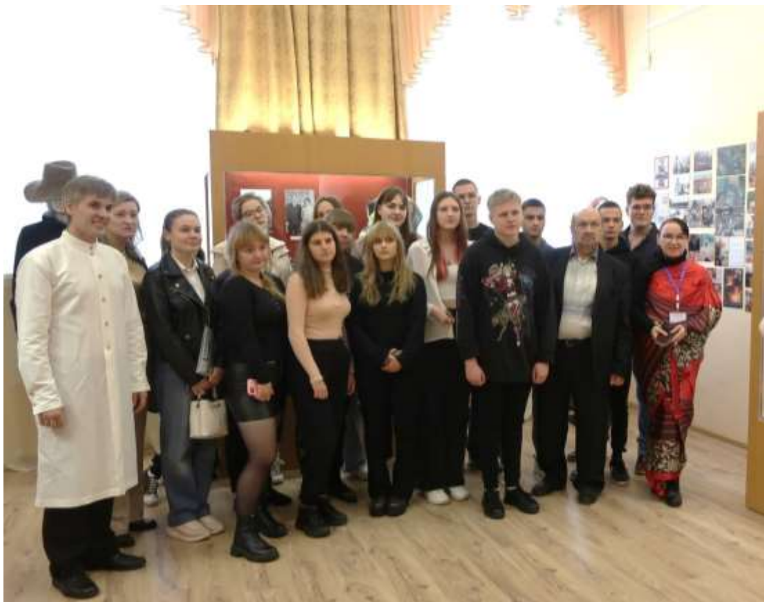
Рисунок 20 – Выставка прошла успешно