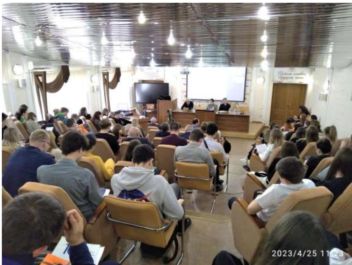
Рисунок 4 – На пленарном заседании