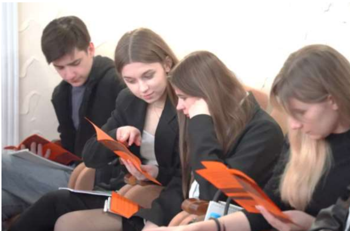
Рисунок 7 – Студенты читают программу форума