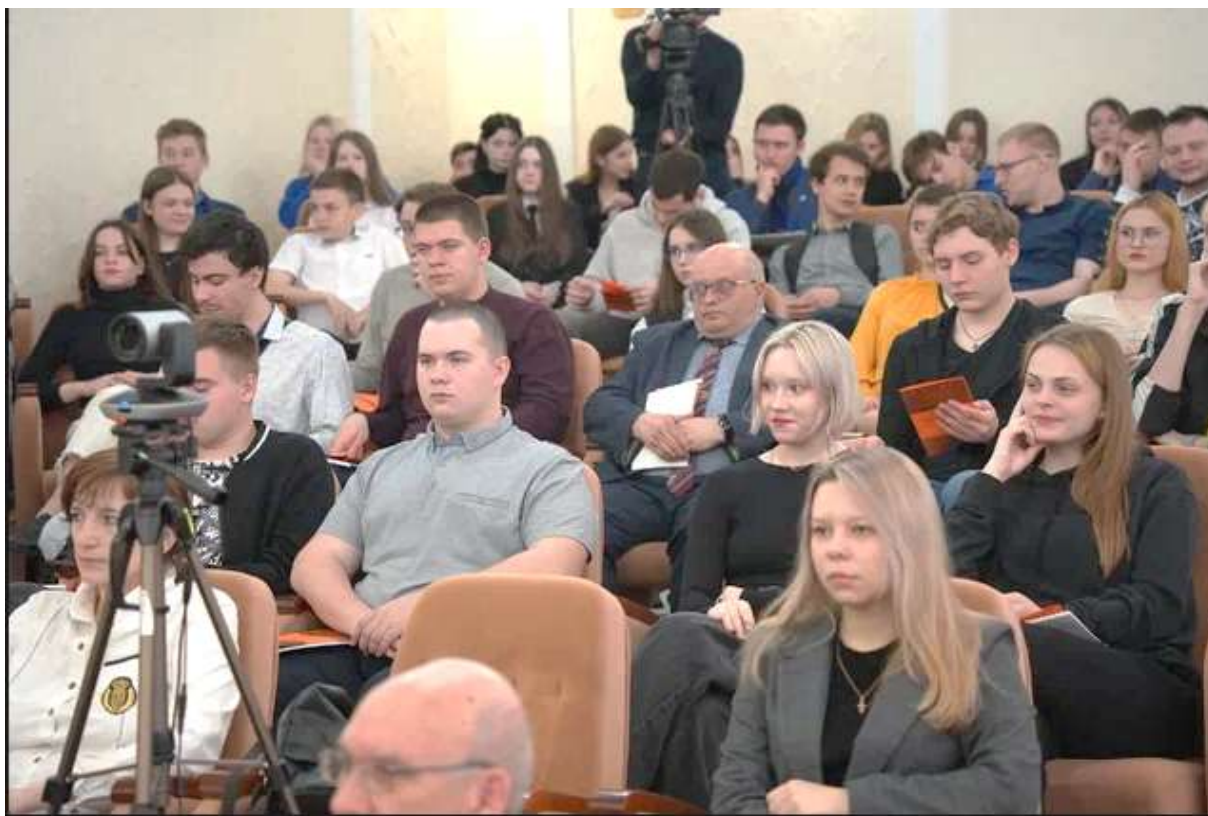
Рисунок 5 – На пленарном заседании