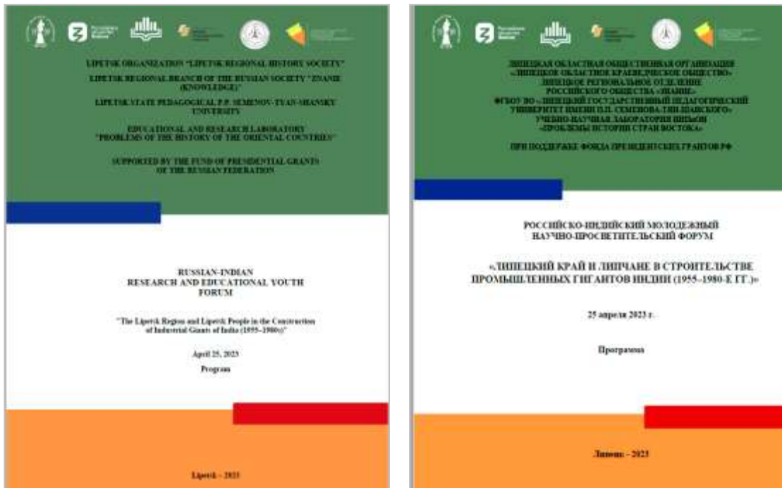
Рисунок 22 – Программа форума на русском и английском языках