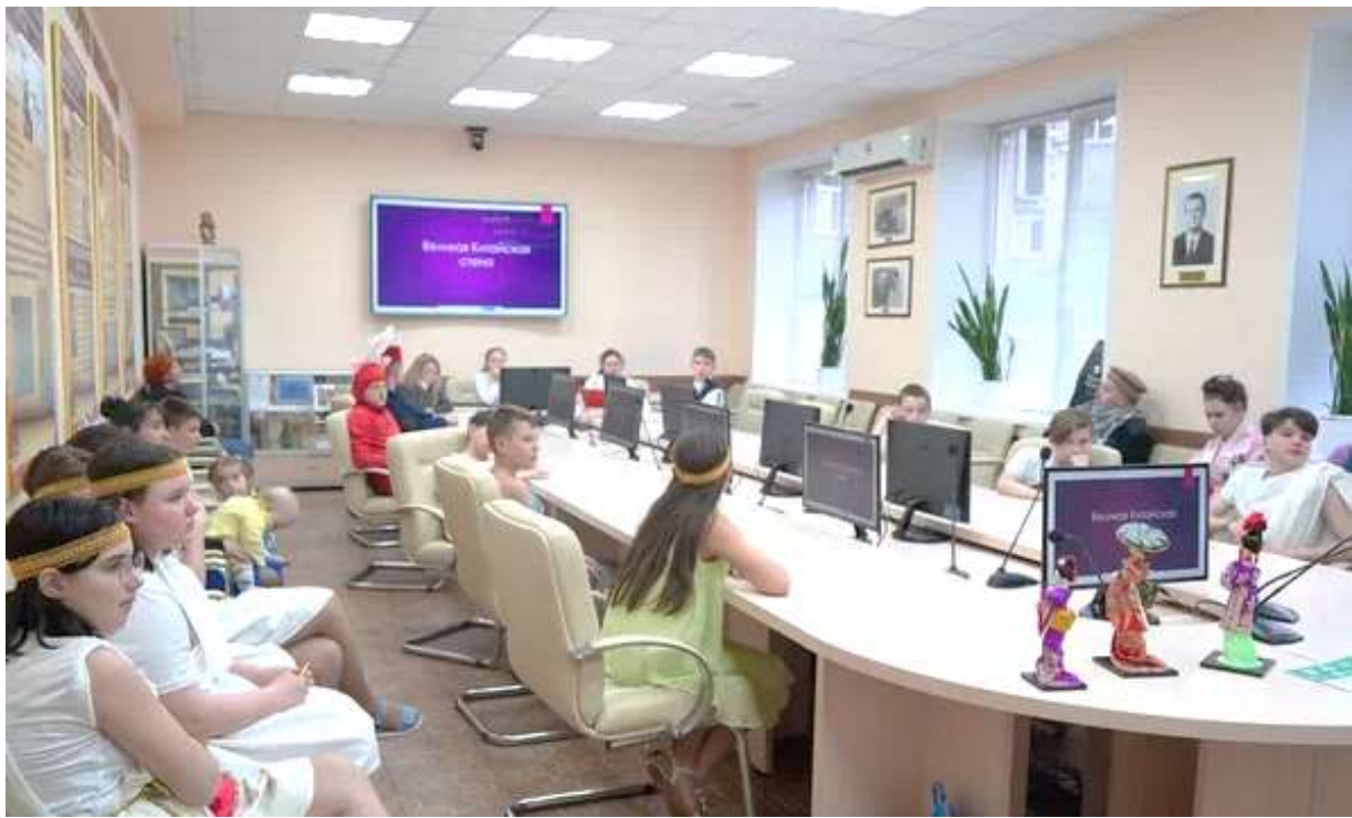
Рисунок 17– Дети на «Съезде народов Востока»