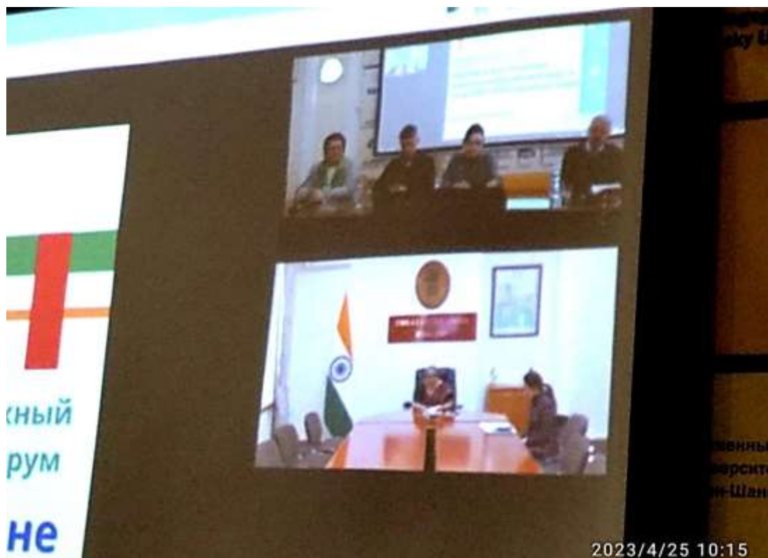
Рисунок 3 – Приветственное слово произносит Заместитель Посла Республики Индия в Российской Федерации Джина Уика