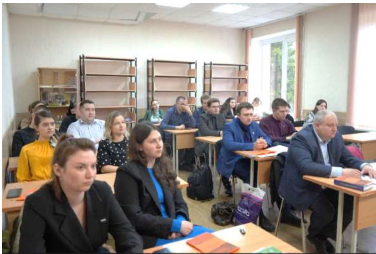
Рисунок 12 – Заседание секции форума