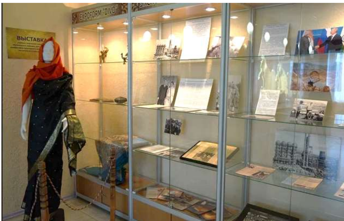
Рисунок 8 – Выставка по теме проекта у зала форума