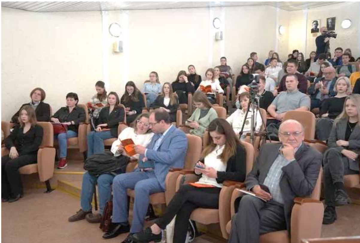
Рисунок 13 – Форум продолжается